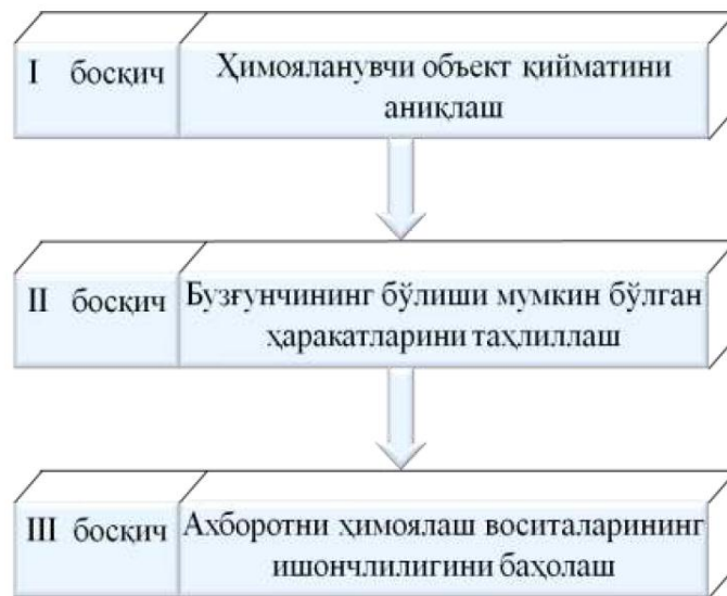
1-расм. Ахборот ҳимояси концепциясини ишлаб чиқиш босқичлари

Киберхавфсизлик концепцияси – ахборот хавфсизлиги муаммосига расмий қабул қилинган қарашлар тизими ва уни замонавий тенденцияларни ҳисобга олган ҳолда ечиш йўллари. Концепцияни ишлаб чиқишни уч босқичда амалга ошириш тавсия этилади.