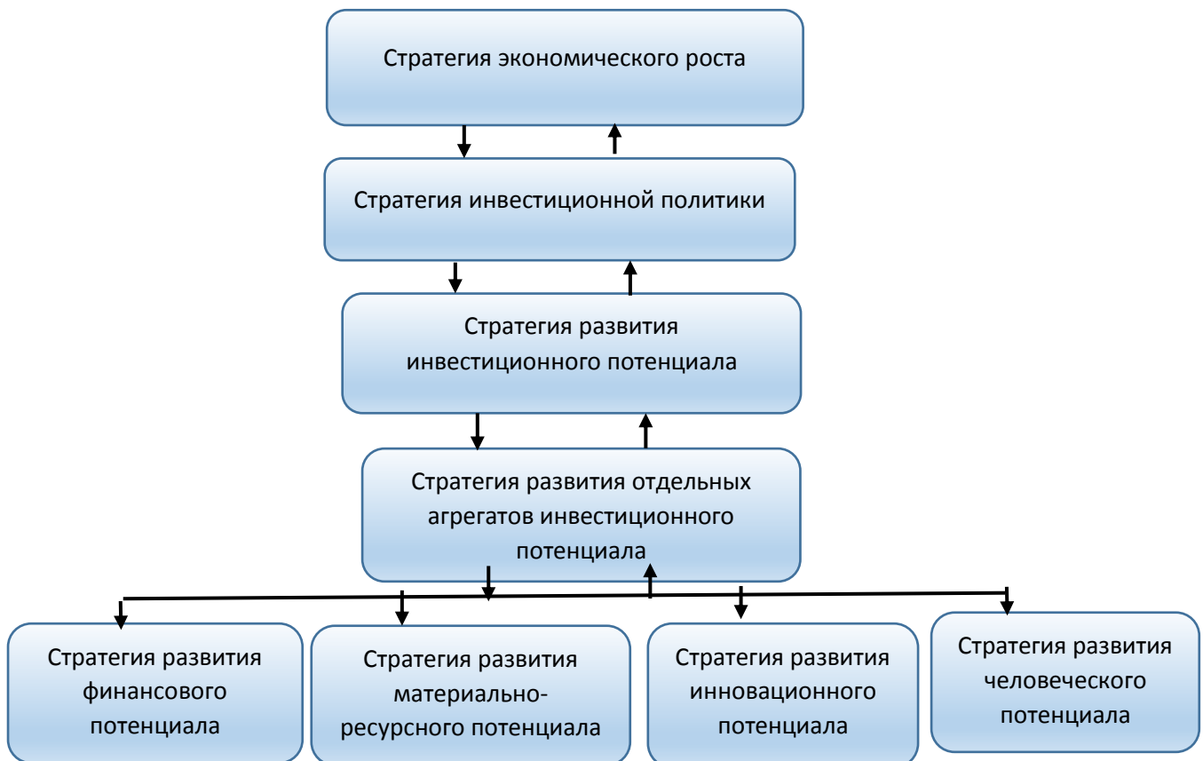
Рисунок 1. Схема формирования стратегии развития инвестиционного потенциала 5

На макроуровне различают стратегию: экономического роста, экономической стабилизации, денежно-кредитную, бюджетно-налоговую, инвестиционную, внешнеэкономическую, ресурсную, социальную и др. Нас интересует, прежде всего, стратегия инвестиционной политики, её формирование, составные агрегаты, порядок и последовательность разработки, механизмы её реализации через призму рационального и эффективного использования инвестиционного потенциала (рис.1).