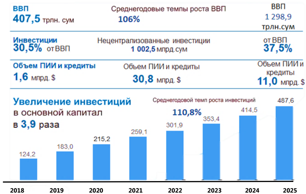
Рис 3. Общи состояние роста инвестиций и ее прогноз на 2025 год. 11

В отчетном периоде в рамках государственной Инвестиционной программы было реализовано 318 крупных инвестиционных проектов на сумму $5,9 млрд долларов, а в рамках региональных инвестиционных программ – 15 710 проектов на сумму $7,4 млрд долларов.