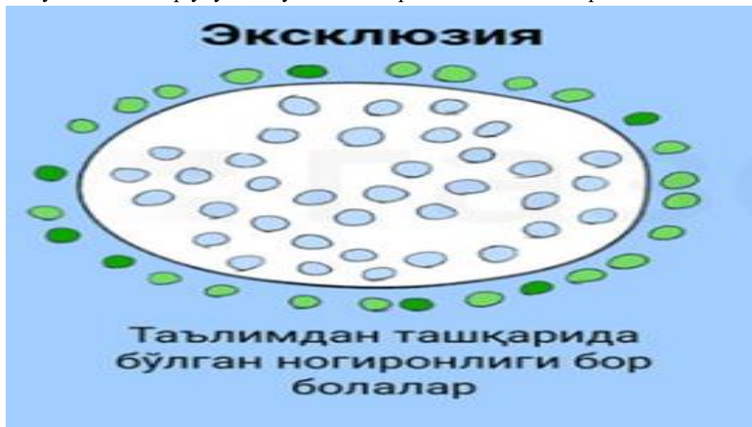
1-расм. Болаларни таълимга қамраб олинишини эксклюзив шакли

Эксклюзия - таълимдан ташқарида бўлган ногиронлиги бор болалар учун таълим бўлиб, бугунги кунда 13868 нафар ўқувчиларни, улардан 5663 нафари қиз болалар 2020 -2021 - ўқув йилида уйда якка тартибда таълим оладиган ногиронлиги бўлган болалар тоифасини ташкил этмоқда[2](ИЛОВА). Яққол кўришиб турибдики жисмоний ёки руҳий ривожланишда нуқсони бўлган болалар улушида ўғил болаларнинг ҳиссаси юқори.