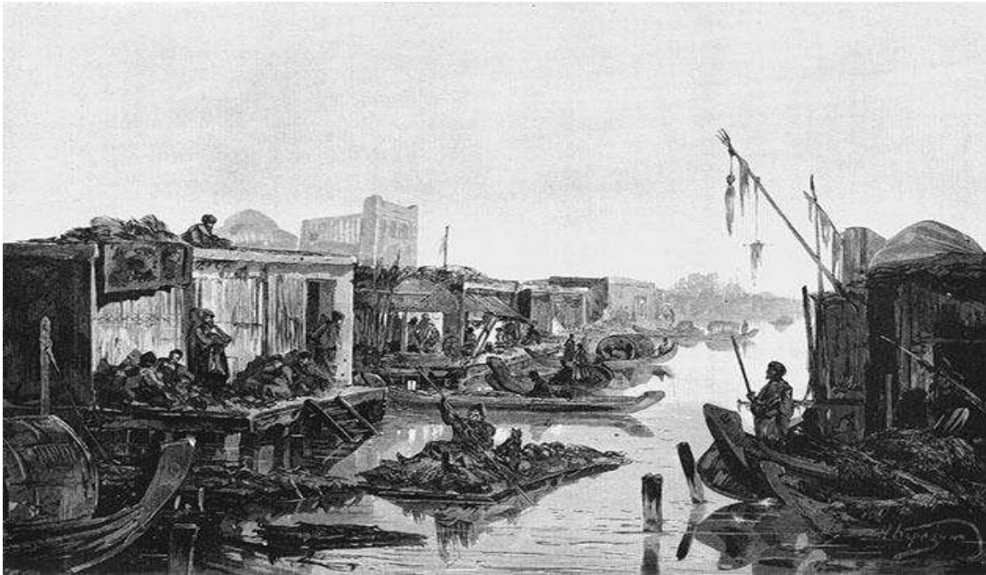
Н.Н.Каразин. “Хўжайли Амударё бўйидаги Венеция” картинаси. 1874 йил.

Н.Н.Каразиннинг “Нокис-Хўжайли соҳили” картинасида ҳам савдогарларнинг катта кемаларда юкларни дарёнинг иккала соҳилларига ўтказаятган манзараси тасвирланган [4,204-205]. Ўша даврда савдогарлар нафақат дарёнинг иккала соҳилидаги халқларни ғалла, балиқ ва бошқада маҳсулотлар билан таъминлаб туришган, балки Амударё юқори оқими бўйлаб Чарджоу шаҳригача ва Орол денгизи орқали Қазали шаҳрига қадар турли хил молларни етказиб беришган[5,Б.107-109].