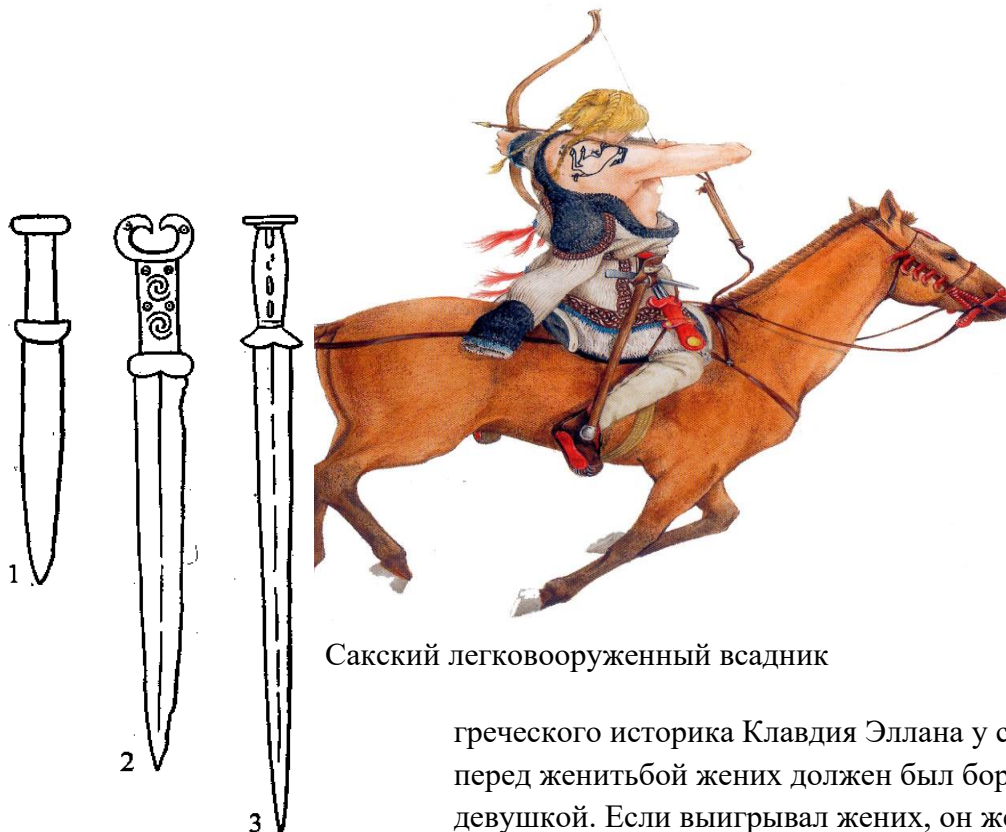
Сакский легковооруженный всадник

Воины Согдианы, Бактрии, Хорезма были бесстрашными и прекрасными наездниками. Всадники оседлых и степных кочевых народов пользовались попоной или мягким седлом без стремян, хотя применяли шпоры. Часто седла были отделаны золотом.