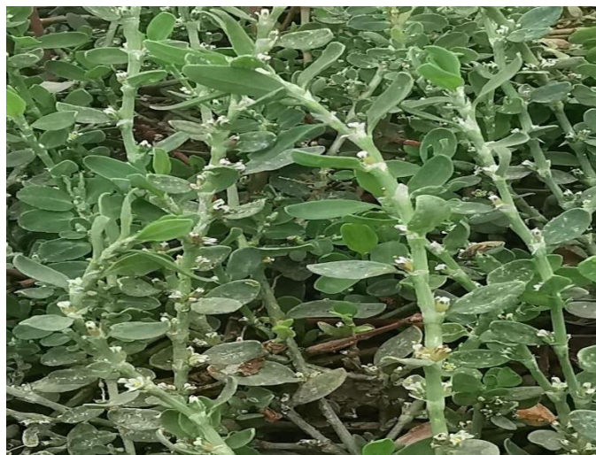
1-rasm. Qushtoron (qiziltasma) o'tining tashqi ko'rinishi.

Qushtoron (qiziltasma) o'simligi dorivor xususiyatga ega bo'lib, o'simlikning yer ustki qismi gullash davrida o'rib olinadi va salqin yerda quritiladi. Quritilgan yer ustki qismlaridan damlama va preparatlar tayyorlanadi.