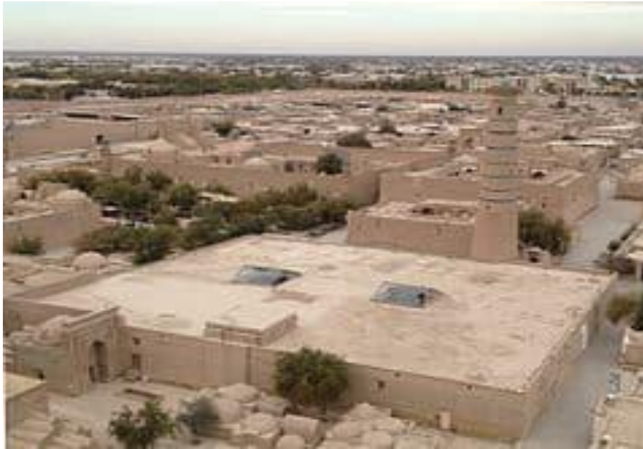
1-rasm. Juma masjidining yuqoridan koʻrinishiva tuynuklari.

Juma masjid haqidagi ilk maʼlumot X asrda Xorazmga kelgan arab sayyohlari al-Muqaddasiy (Maqdisiy) va al-Istaxriy yozmalarida uchraydi. Manbalarga koʻra, Juma masjidning dastlabki binosi buzilib ketgan va oʻrniga Abdurahmon Mehtar buyrugʻiga binoan 1788-yilda xuddi shu usulda kattaroq yangi masjid qurilgan. Masjid oʻziga xos tarhi va hajmi bilan ajralib turgan. Bir qavatli boʻlib, atrofi gʻishtin devor bilan oʻralgan.