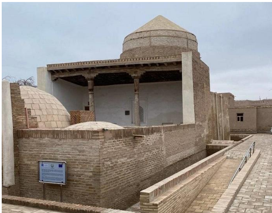
6-rasm. Bog‘bonli masjidining tashqi ko‘rinishi va gumbazi.

Zalning tojlari arqonli yelkanli sharsimon gumbaz (6-rasm) bilan bezatilgan. Ivan ikkita qo‘llab-quvvatlovchi ustunda tekis nurli tom bilan qoplangan. Ivan devoridagi shkaflar, darvozaxonning yon xonalari “balxi” gumbazlari bilan qoplangan.