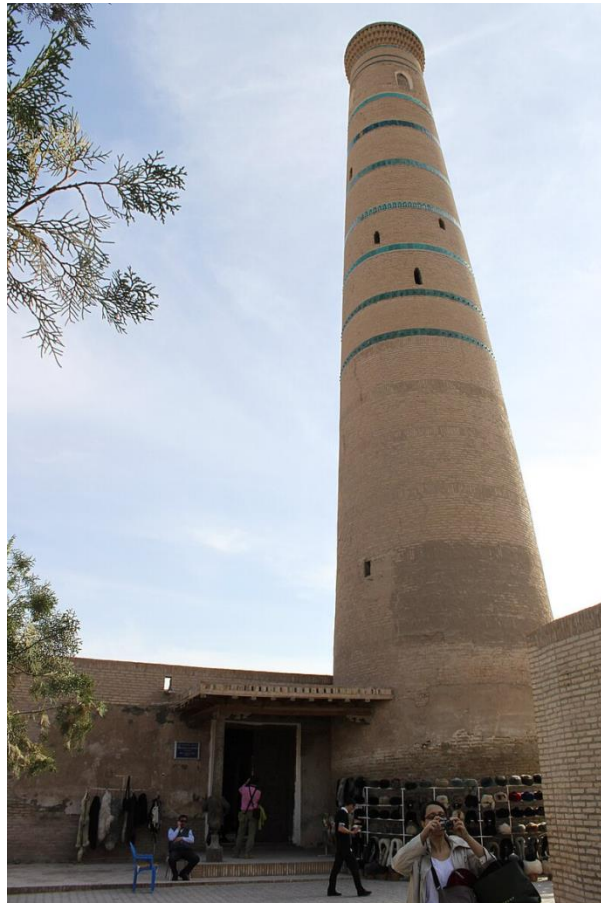
3-rasm. Juma masjidi yonidagi minora.

Masjid yonidagi minora XVII asrda qulab tushgan, XVIII asrda mayda pishiq g‘ishtdan qayta tiklangan. Minora yuqoriga tomon ingichkalashib boradi. Tepasiga sharafo va g‘ishtdan dandana xoshiya belbog‘lar ishlangan (3-rasm).