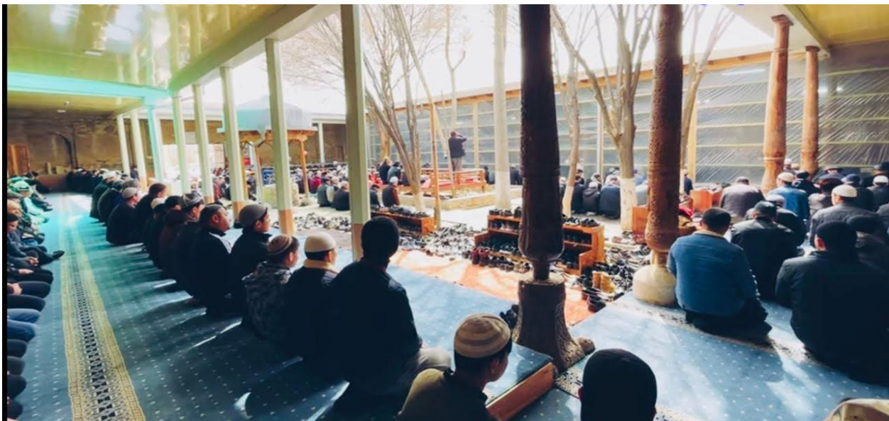
4-rasm. Said Ota masjidining hovli qismida namoz o'qish jarayoni.

Said ota masjidining boshqa masjid qurilishlaridan farqi shuki, o'rtasida hovlisi bor (4-rasm). Quduq qazilgan va chog'roq gulzor bo'lgan hovlichaning janubiy tomoni 2 qator va qolgan tomonlari 1 qator yog'och ustunli ayvon bilan o'ralgan. Masjidga kirish yo'li sharqqa qaragan. Eshikning ro'parasida, masjidning g'arbiy devori bo'ylab gumbazli (5-rasm) xonaqoh va shimol tomonidagi katta xonaning tepasida kichik masjid qurilgan, uning yonida qoravulxona bor. Avval xonaqoh, so'ng shimoldagi yopiq masjid va keng hovlisi bo'lgan katta inshoot qurilgan bo'lishi kerak. Xovli tomonlari 29,3x 26,2 metr, xonaqohiniki 9,6x 14,4 va qishki masjid 14,7 metr.