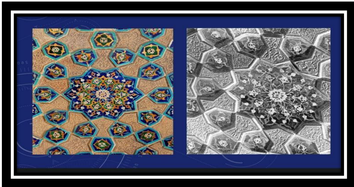
3-rasm. Garih va islimiy naqshlarning birgalikda qo'llanishi.

ko'p ishlatiladi. Bu islimiy naqshlarni bir-biridan markazdagi asos shakli farqlab turadi: masalan, patnisni eslatuvchi to'rtburchakli, turli turunj shaklli mayda mozaikaga o'xshab ketadigan koshin shakli.