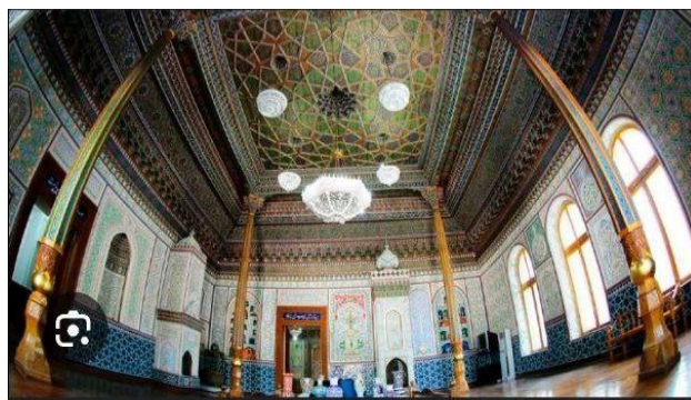
4-rasm. Masjidlarda islimiy naqshlarning qo'llanishi.

Ajdodlarimiz ranglarning xususiyatlarini yaxshi bilganlar. Ular atrofimizni o'rab turgan tabiat ranglariga shaydo bo'lganlari uchun zangori, lojuvard va yashil ranglarni ko'p ishlatgan. Binalarning koshin va pargin sirlariga, oftob nurida tovlanishini hamda atrofda ranglar bilan uyg'unligini hisobga olib, munosib bo'yoqlar tanlangan. Pargin va koshinlarda, asosan, lojuvard, zangori, yashil, sariq va oq ranglar ishlatilgan.