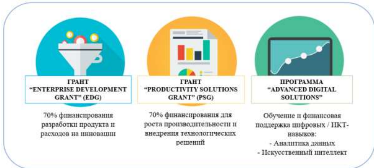
Рис. 3. Гранты, выделяемые правительством Сингапура на цифровую трансформацию малого и среднего бизнеса [8]

-передовые цифровые решения (ADS). Это программное обеспечение, созданное для автоматизации бизнес-процессов и ускорения работы предприятия. ADS был разработан компанией из Сингапура, и финансовая поддержка по этой программе может покрывать до 80 процентов затрат на внедрение передовых технологий.