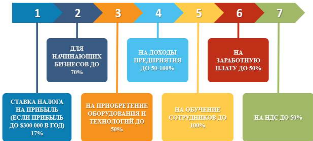
Рис. 4. Примеры налоговых льгот малому и среднему бизнесу в Сингапуре

Налоговые стимулы для бизнеса. Сингапур является одним из самых привлекательных мест для развития малого и среднего бизнеса. В этой стране предоставляются многочисленные налоговые льготы и стимулы, которые помогают бизнесу получить доступ к дополнительным ресурсам и увеличить свои прибыли.