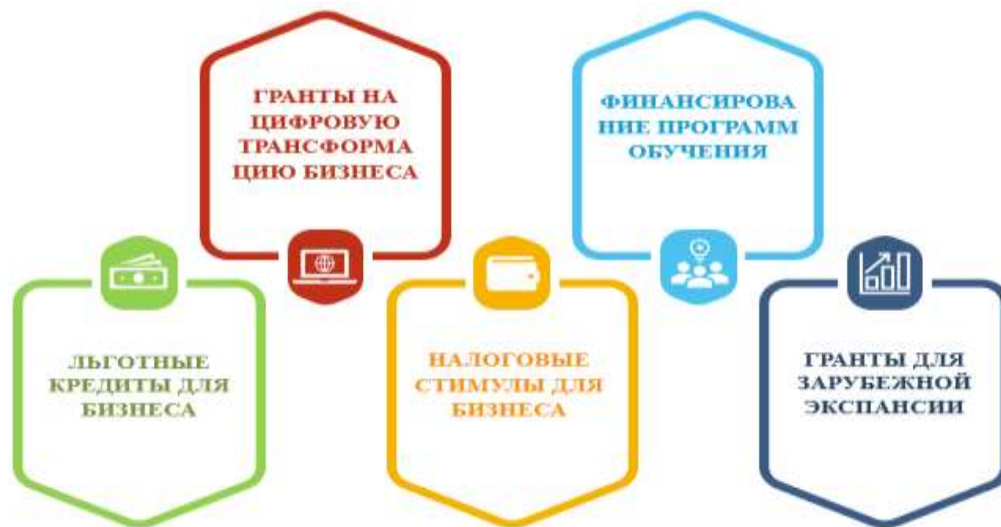
Рис. 2 Меры по государственной финансовой поддержке малого и среднего бизнеса в Сингапуре

году в стране действовало свыше 64 тысяч предприятий малого и среднего бизнеса, которые образовали 70 процентов всех рабочих мест в стране [6].