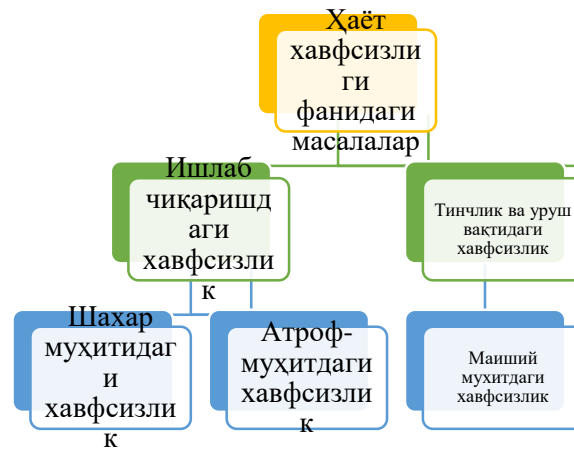
2-рasm. Hayot faoliyati xavfsizligi fanidagi umumiy masalalar

Hozirgi zamon fan va texnikasining o'sishi, yangi texnologiya va mashina-mexanizmlarning joriy etilishi ishlab chiqarishda ishlayotgan har bir xodimning yuqori malakali, texnika qonunlarini tushunadigan va unga amal qiladigan bo'lishlarini taqozo qiladi.