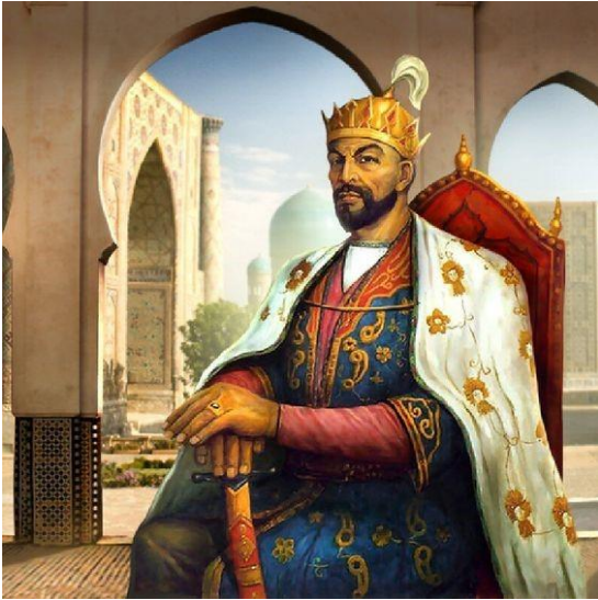
М.Набиев.Амир Темур портрети. 1993-й. 1997-й.