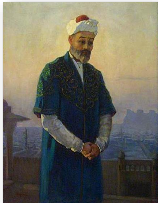
А.Абдуллаев. Алишер Навоий портрети,