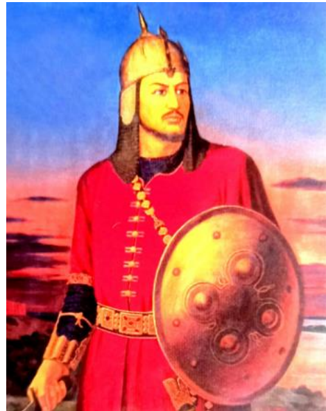
Р.Худойберганов. Жалолиддин Мангуберди. 1998-й.